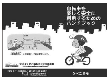
図2 うべこまち発行の自転車ハンドブック（表・裏表紙） うべ交通まちづくり市民会議HP http://www.ubekomachi.net/ 「自転車を楽しく安全に利用するためのハンドブック」内容を掲載しています

うべこまちは、2010年の設立当初から都市計画道路鍋倉草江線（通称・産業道路）での自転車レーンを視野に入れ活動してきた。同年11月に同区間で市民草の根通行実験を行った。2011年度～2016年度には、NPO自転車活用推進研究会の小林成基理事長や疋田智理事、地球の友・金沢の三国成子氏ら、自転車政策面でのオピニオンリーダーの方々を招き、自転車先進地の事例を学ぶための自転車