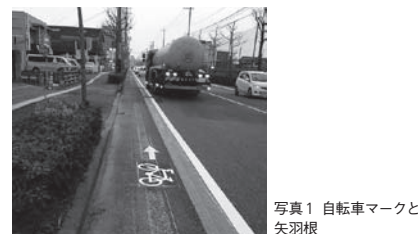
写真1 自転車マークと矢羽根