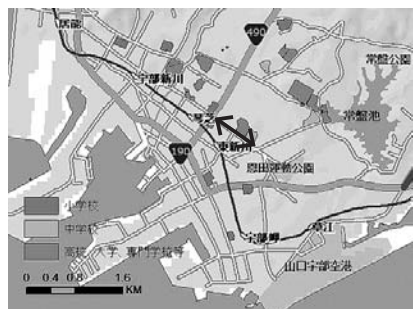
図1 宇部市の地図と自転車レーンの区間（黒矢印）

宇部市の人口は167,484人（2017.4.1現在、住民基本台帳による）、面積288km 2 である。古くから瀬戸内海を干拓し、海岸埋め立てにより工場地帯ができており、中心市街地は平坦な地