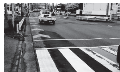
写真2 清水川交差点の矢羽根表示